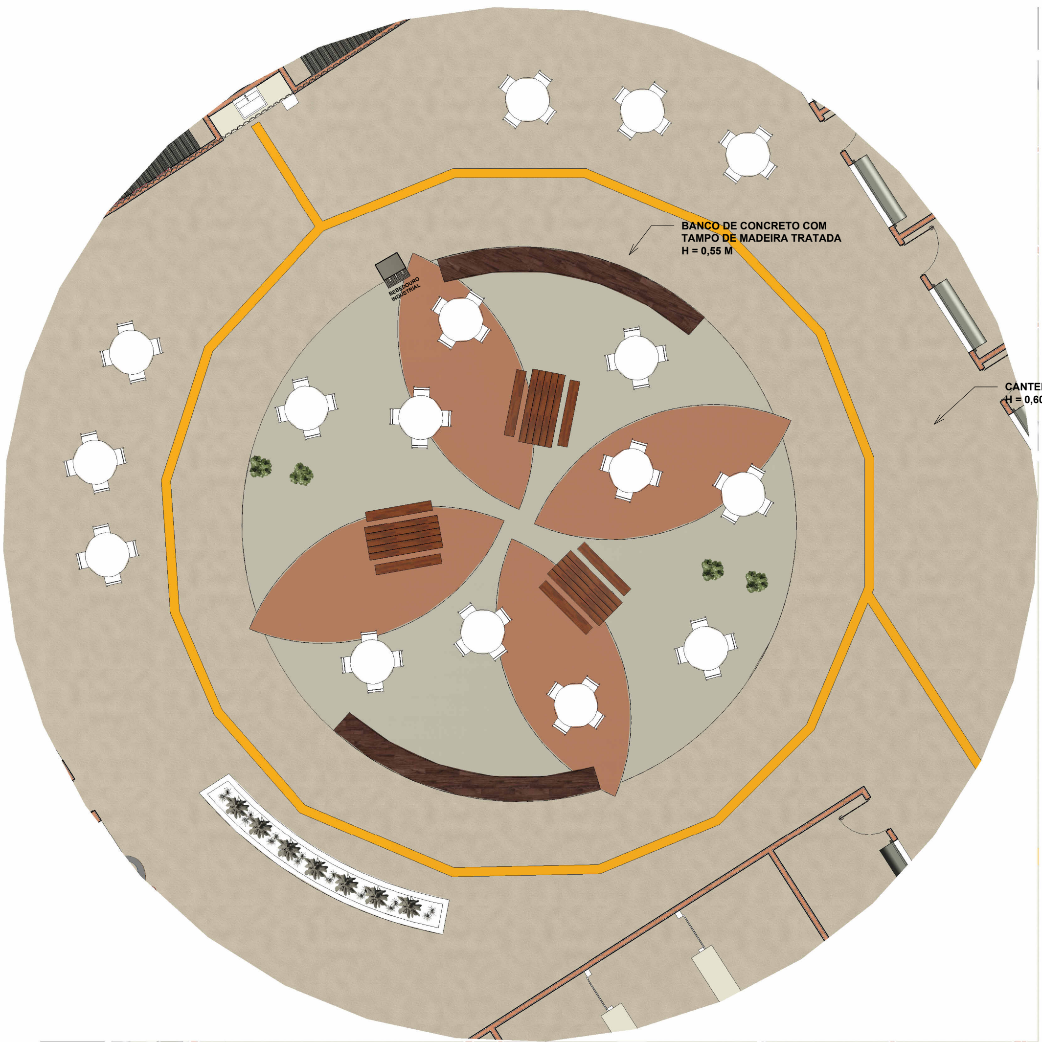
2 PRAÇA DE ALIMENTAÇÃO 1 : 100